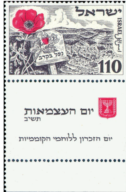
בול שעיצבה אוטה וליש, 1952

1. לעצוב בול יום העצמאות הרביעי של מדינת ישראל, הפרח שנבחר כסמל היה פלנית.