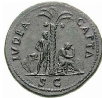
Classical Numismatic Group

מטבע 'יהודה השבויה' שטבע אספסיאנוס הנציב הרומאי ששלט גם על ארץ ישראל, כדי לחגוג את ניצחונו על המורדים היהודים. במטבע נראית אישה יהודיה שבויה היושבת אבלה תחת דקל, כשמצידו האחר עומד שבוי יהודי שידי קשורות מאחורי גבו. סביבם פזורים כלי נשק.