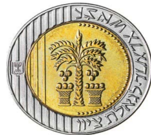
זכויות לבנק ישראל

מטבע 10 שקלים חדשים. על המטבע עץ דקל עם תמרים שלמרגלותיו שני סלים. משמאל מופיע סמל מדינת ישראל, ובמחצית הימנית של הטבעת נכתב "לגאלת ציון" בכתב העברי הקדום ובכתב עברי בן ימינו. מקורו של העיצוב הוא במטבע עברי קדום מהשנה הרביעית למלחמת היהודים ברומאים, לפני חורבן בית המקדש השני.