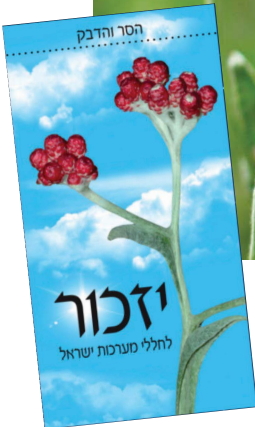
פרחי 'דם המכבים'