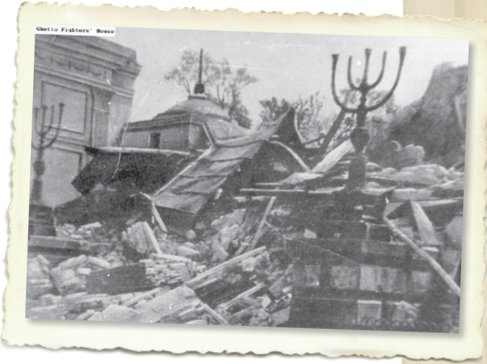
ארכיון לוחמי הגטאות