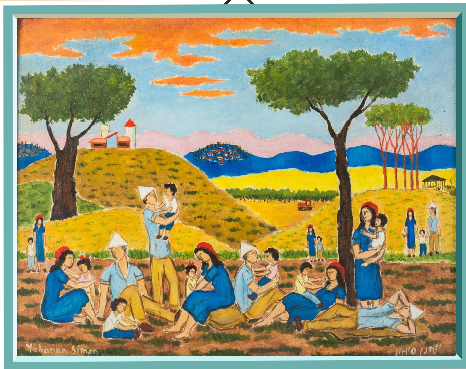
1 יוחנן סימון, מנוחת שבת בקיבוץ, 1947 (באדיבות בנות האמן: איה וניצה סימון)