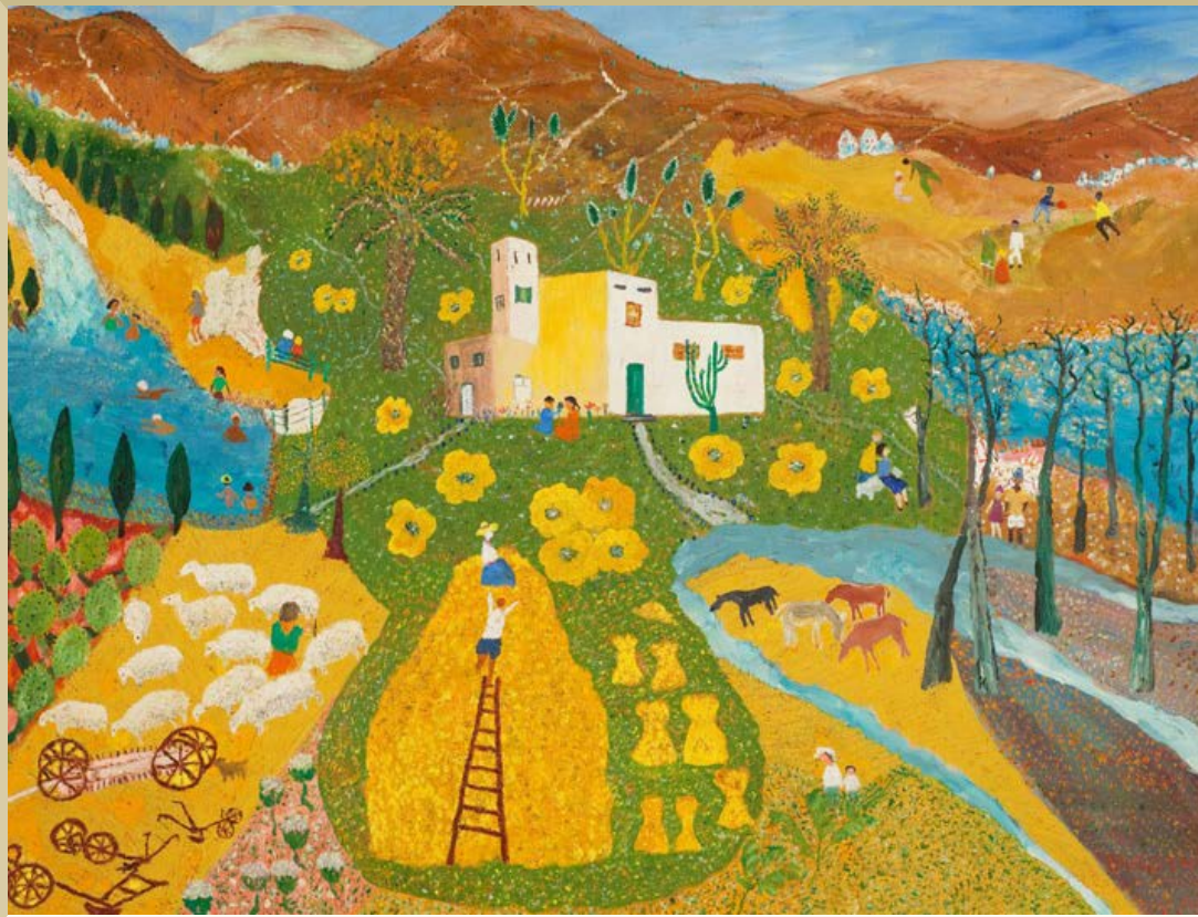
4 שבת לרגלי הר גלבו, יהושע ברנדשטר