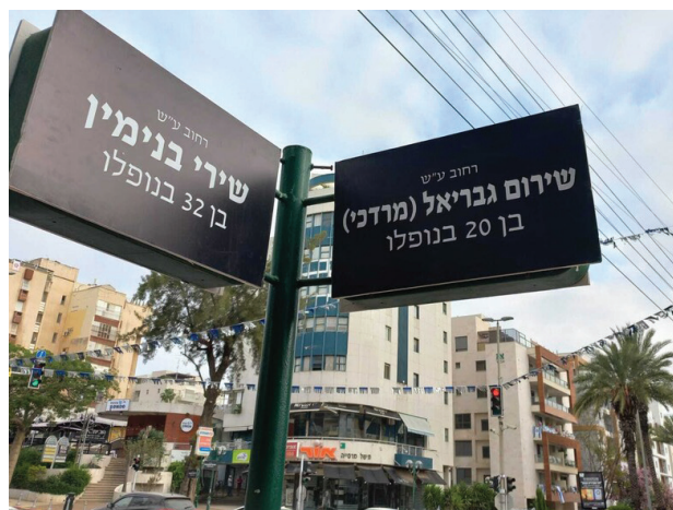
מיזם הנצחה ברעננה