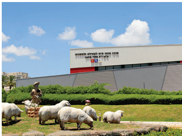
אולם ע"ש יא חללי מינכן באור יהודה